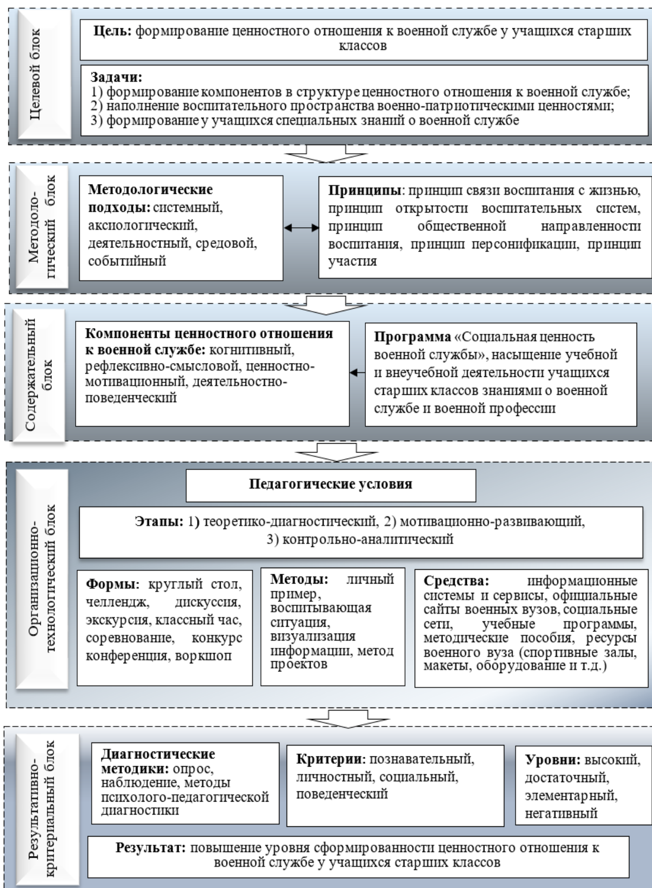
Рисунок 1 – Модель формирования ценностного отношения к военной службе у учащихся старших классов