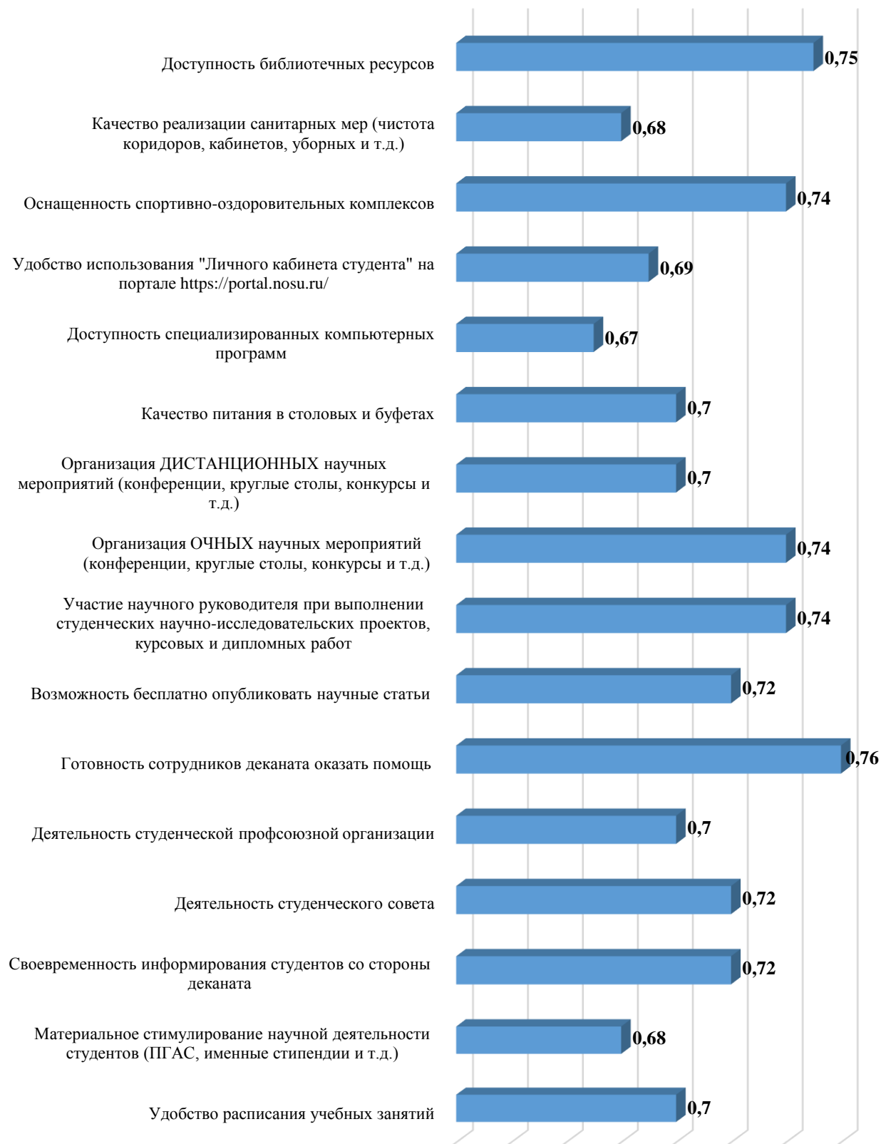
Рисунок 6. Индекс удовлетворённости различными аспектами, поддерживающими процесс обучения в СОГУ