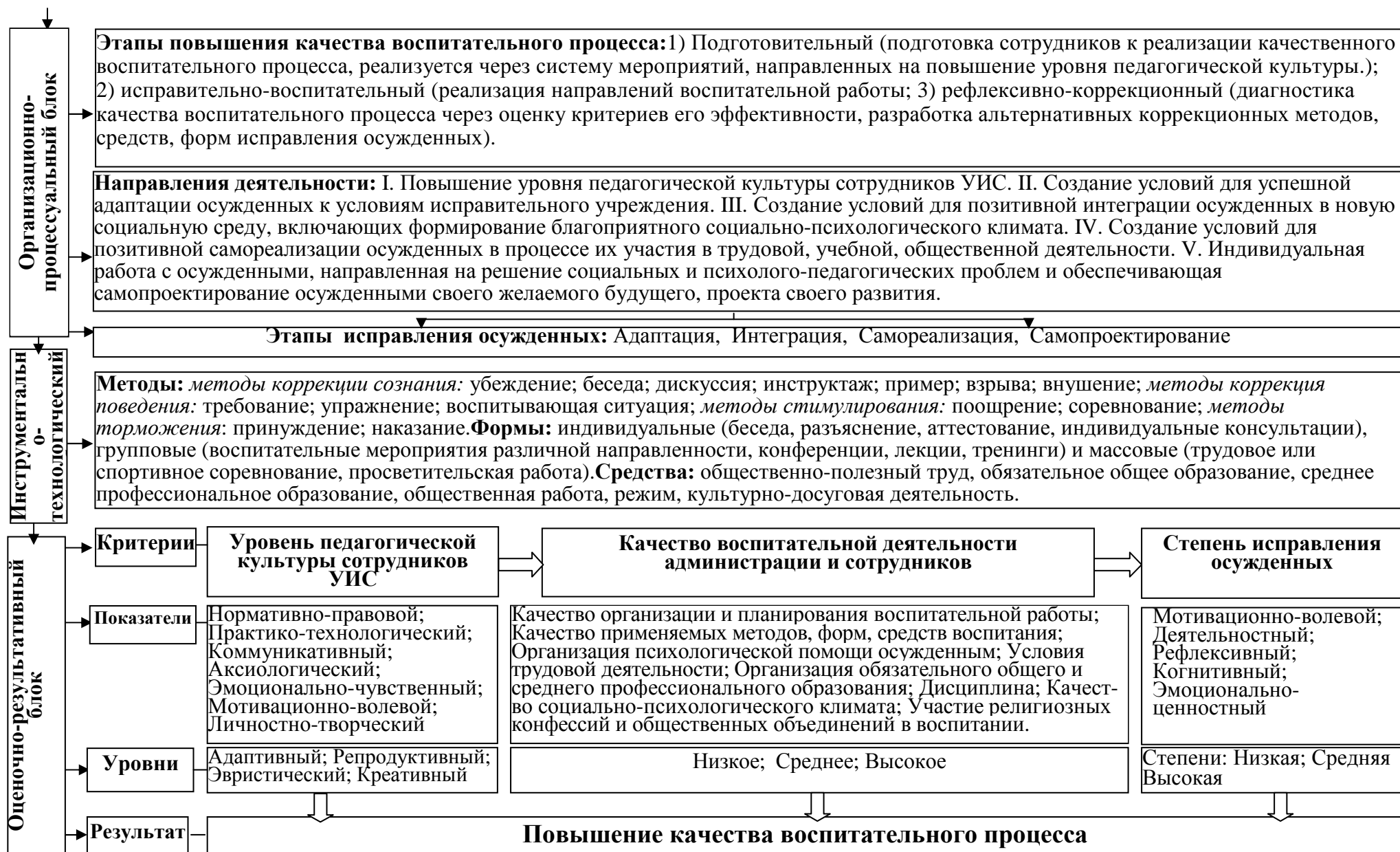
Рисунок 1. Организационно-педагогическая модель повышения качества воспитательного процесса исправительном учреждении на основе совершенствования педагогической культуры сотрудников УИС.