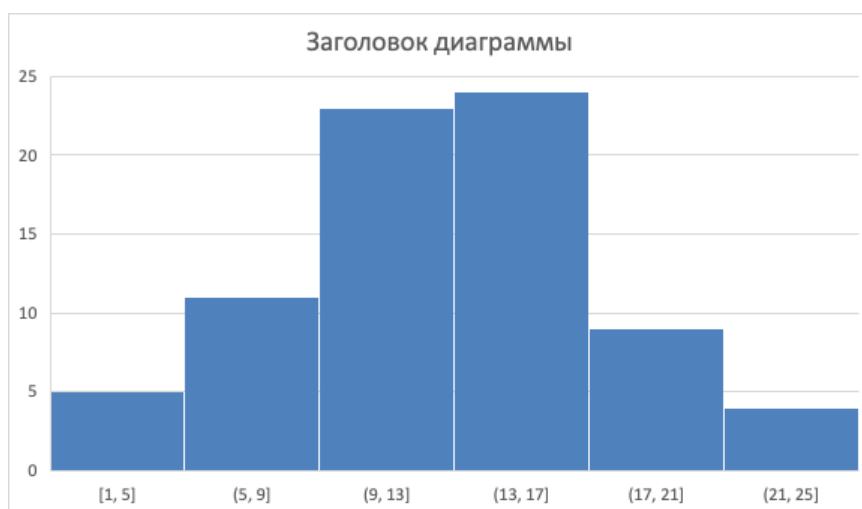
Рис.1 Структура налоговых доходов федерального бюджета за ... (составлено по данным (таблицы или материала).....)