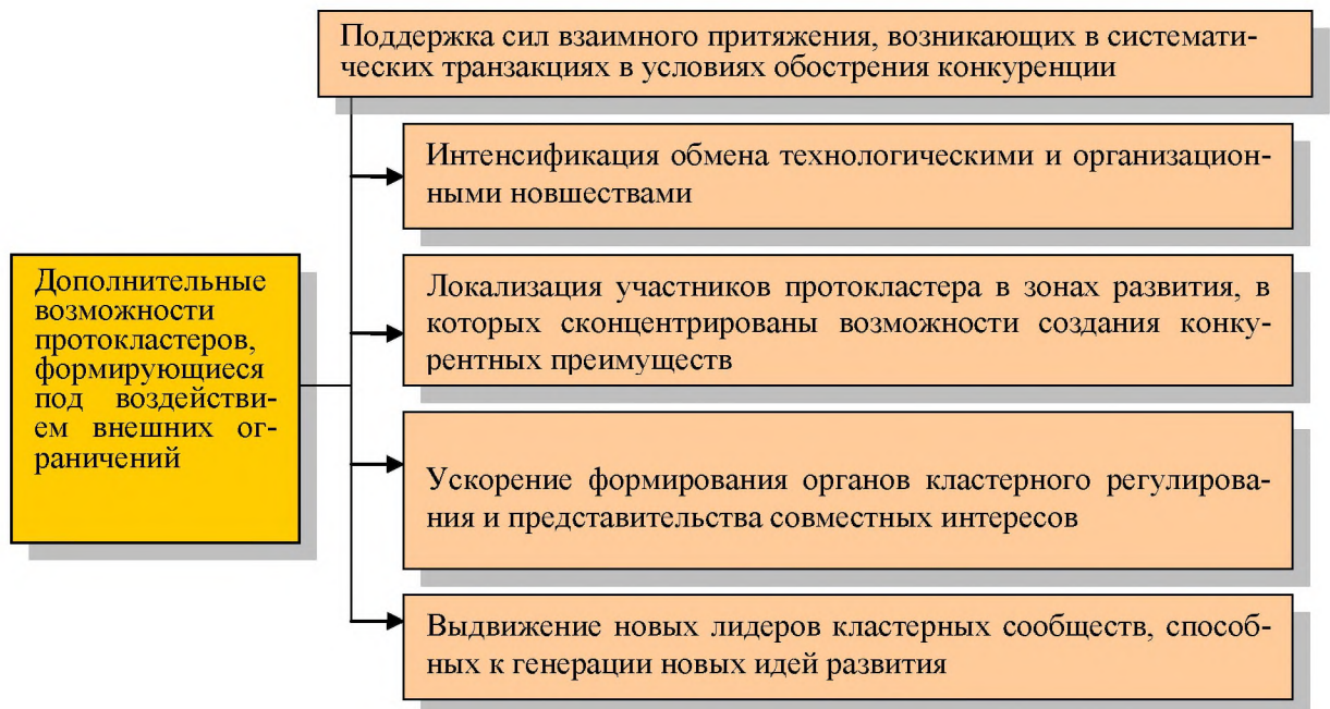
Рисунок 4 – Дополнительные возможности протокластеров, формирующиеся под воздействием внешних ограничений

Необходимо учитывать, что протокластеры в условиях затяжной кризисной ситуации способны из реверсивных структурных элементов превратиться в элиминарные формы структурной организации экономики.