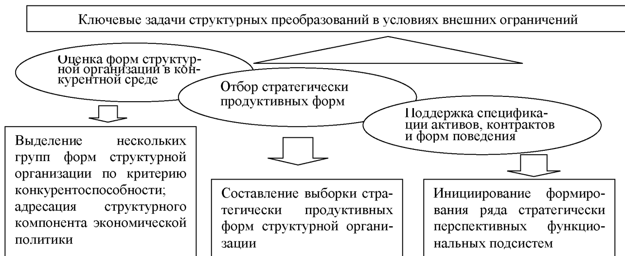
Рисунок 3 – Ключевые задачи структурных преобразований российской экономики в условиях внешних ограничений и их возможные результаты

Во второй главе « Анализ структурной организации экономики в условиях внешних ограничений: фокусирование на мезоуровне » осуществлены систематизация элементов структуры экономики в условиях внешних ограничений и оценка указанных элементов. Систематизация проведена с применением признака соответствия вызовам преобразований (табл. 2).