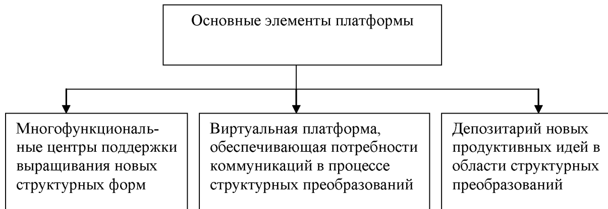
Рисунок 5 – Основные элементы инфраструктурной платформы для выращивания перспективных структурных форм экономики

ства совместных интересов. Силы рыночного притяжения представляют одну из сторон, участвующих в структурных преобразованиях, другая сторона – государственные управление и экономическая политика.