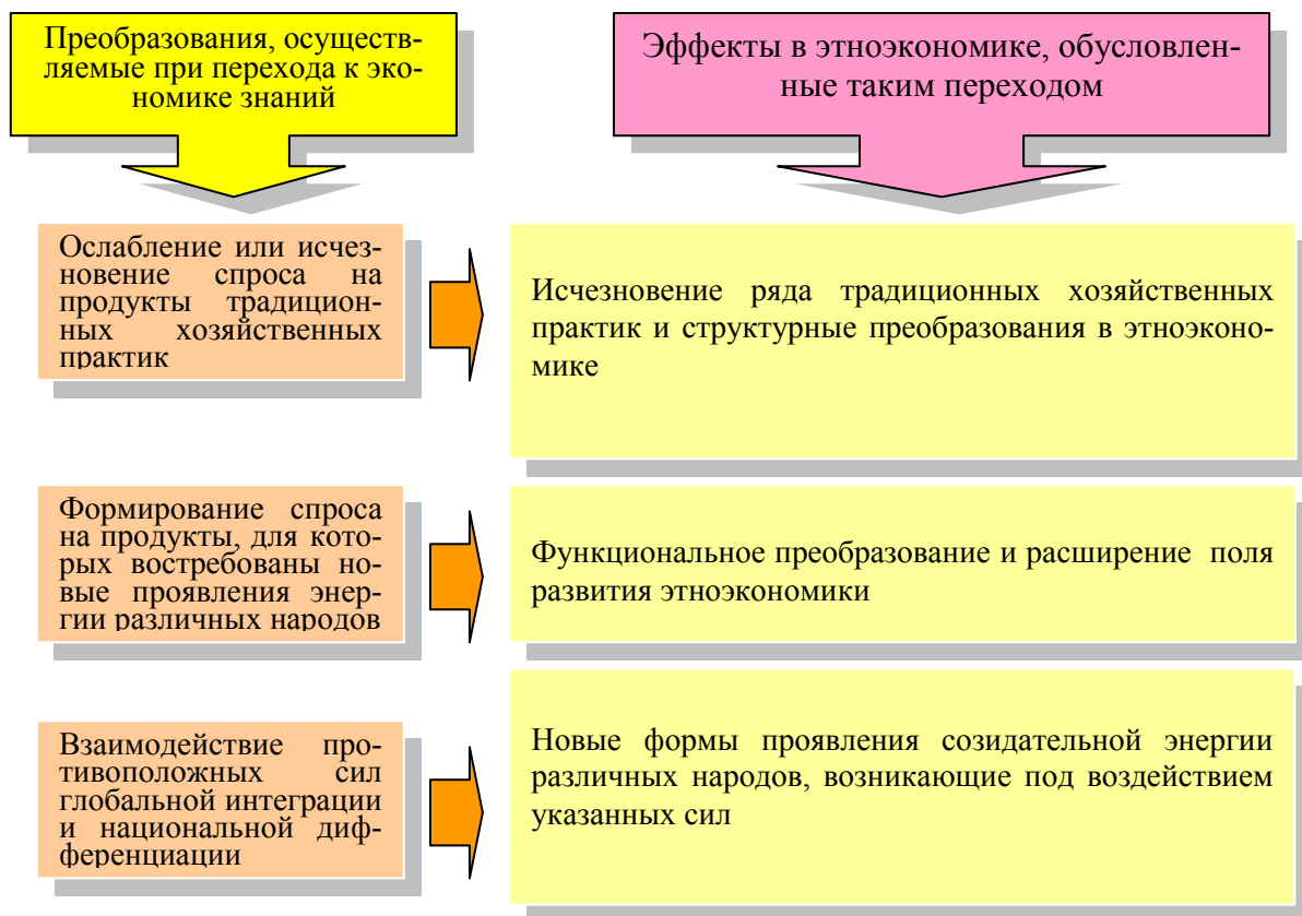
Рисунок 1 – Эффекты в этноэкономике, обусловленные переходом от индустриальной экономики к экономике знаний 1

Изменения в практике этноэкономике вызывают к жизни адекватные перемены в теории, в том числе, в ее базовых положениях. Автором выдвинута новая научная идея анализа развития теории и практики этноэкономике в условиях современных социально-экономических преобразований с учетом присущего новой экономической реальности доминирования сил национальной дифференциации в их взаимодействии с силами глобальной интеграции, что позволило определить изменения концептуальных оснований этой теории.