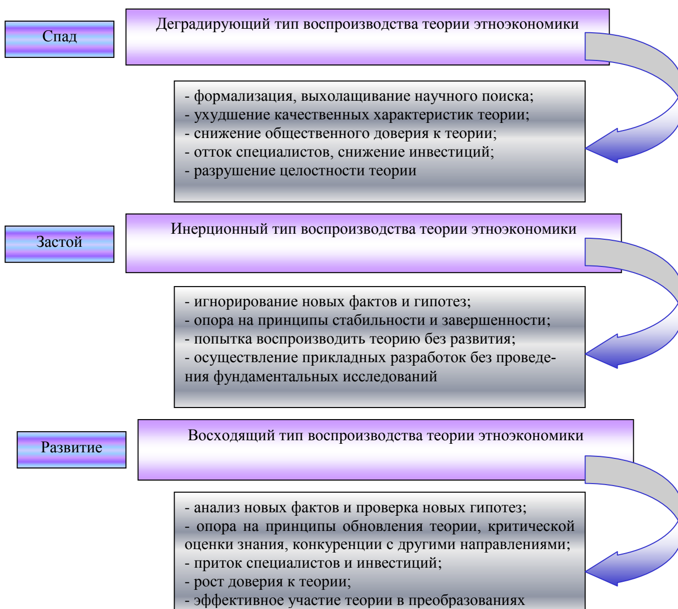
Рисунок 2 – Три типа воспроизводства теории этноэкономики в условиях современных социально-экономических преобразований 1

Во второй главе «Разработка векторов развития теории этноэкономики, формирующихся в условиях современных социально-экономических преобразований» проведена систематизация направлений развития теории этноэкономики в современных условиях, социально-экономических преобразований, осуществлена разработка двух основных векторов развития данной теории. Автором выделены три типа воспроизводства теории этноэкономики в контексте современных преобразований (рис. 2).